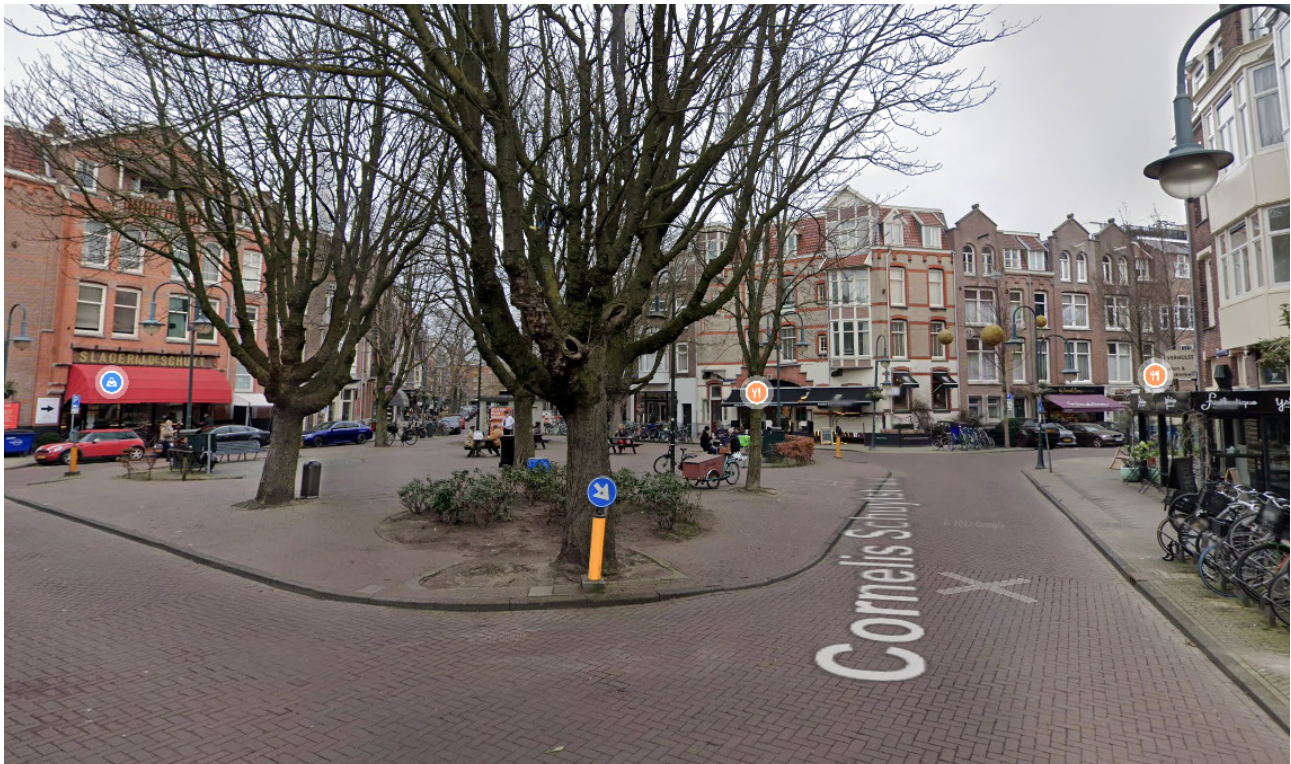
Figuur 4: De Cornelis Schuytbuurt (Amsterdam) is met 0,5 m 2 groen per woonadres een zeer versteende buurt, waarbij boomkroonbedekking echter niet is meegenomen

te zien. Dit is een van de meest versteende buurten van Nederland, met in 2024 een halve vierkante meter openbaar groen per woonadres. Boomkroonbedekking in vierkante meters is hierin niet meegenomen, maar zoals te zien op de afbeelding zijn er wel bomen aanwezig. Bomen leveren een positieve bijdrage aan de leefbaarheid van de stad, bijvoorbeeld door het verbeteren van de luchtkwaliteit. Ze bieden verkoeling en ook schuilplekken voor vogels en insecten.