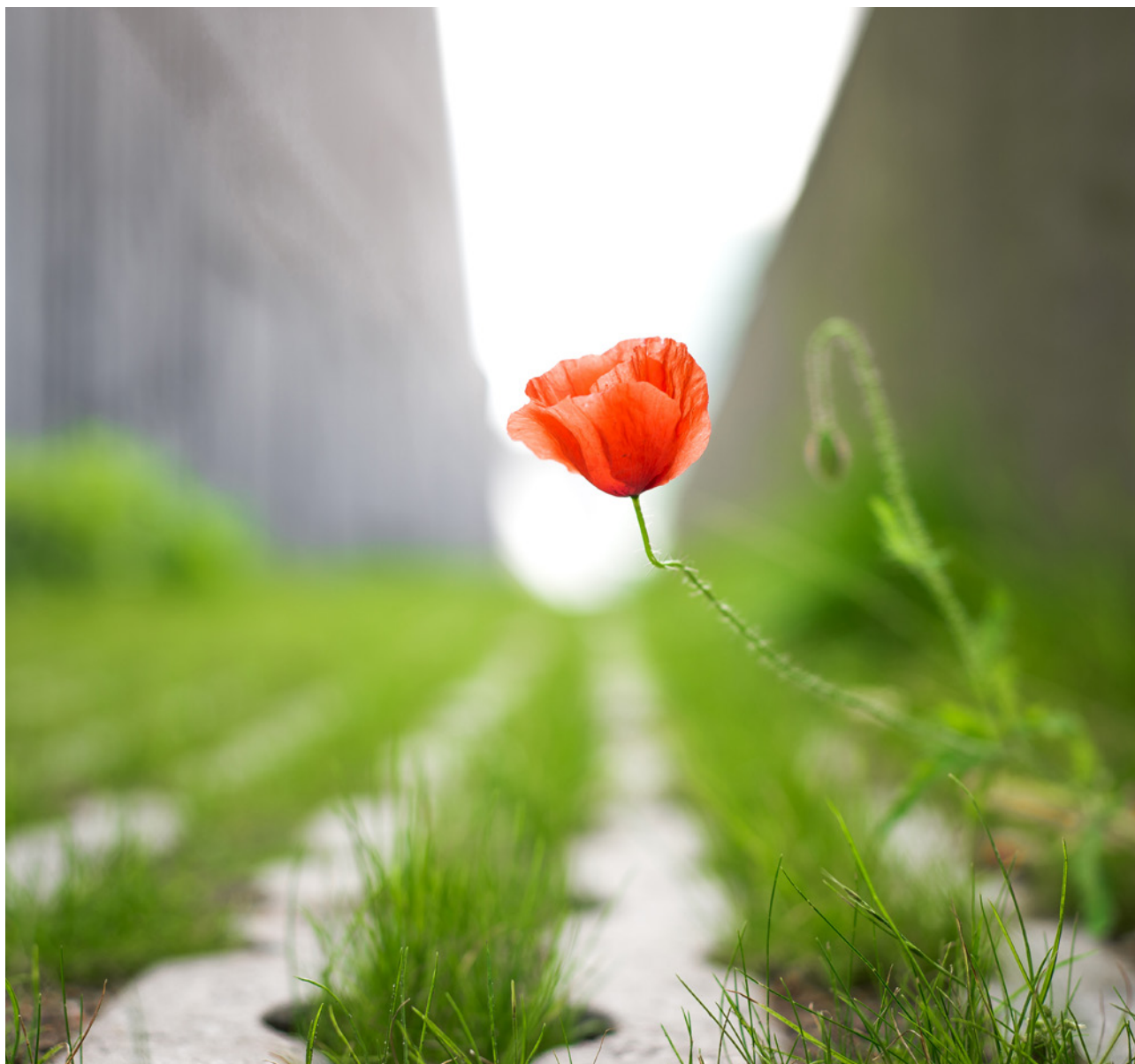
Tabel 12: Totaalbeeld boomkroonbedekking in G32-gemeenten in 2023.