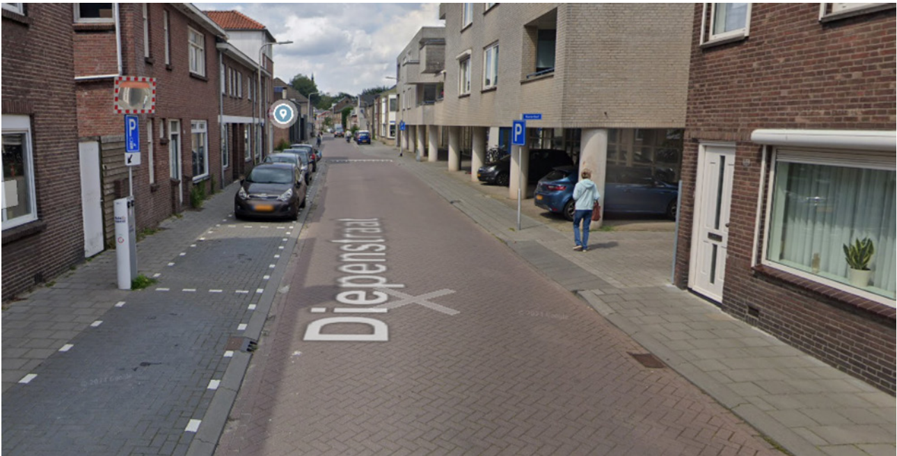
Figuur 2: Een straat zonder openbaar groen in de meest versteende buurt van Tilburg: de Schildersbuurt.