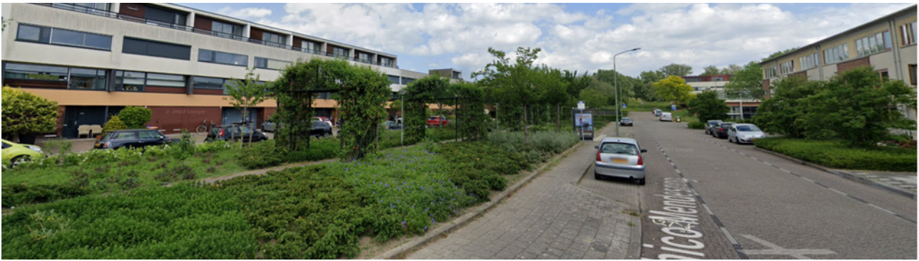
Figuur 3: In de buurt Azobe in Dordrecht is veel openbaar groen: per woonadres 252 m 2 (Google Streetview).